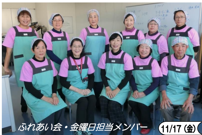
ふれあい会・金曜日担当メンバー

そしてその思いを現在まで引き継いでくださっている現会員にも心から拍手を送りたいと思います。