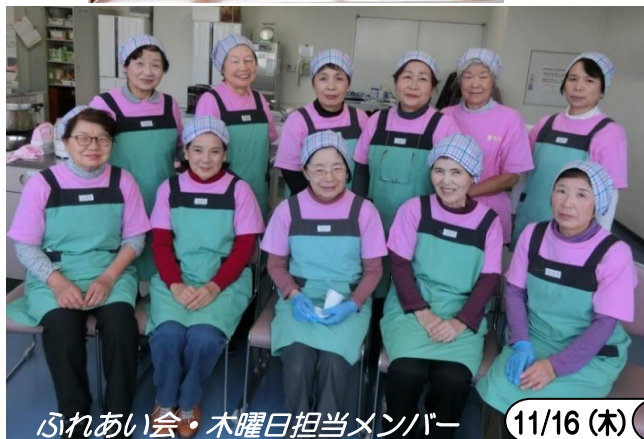
ふれあい会・木曜日担当メンバー

「身を死して大地に善意の実を結ぶ、からだそうです。当時はボランティアという言葉がまだまだ認識されていない時代ながら地域に根ざした活動（友愛訪問・福祉施設への協力・一人暮らし高齢者への年賀状等々）を地道に実践されていました。