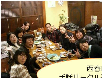
西春日井 手話サークル連絡会飲み会