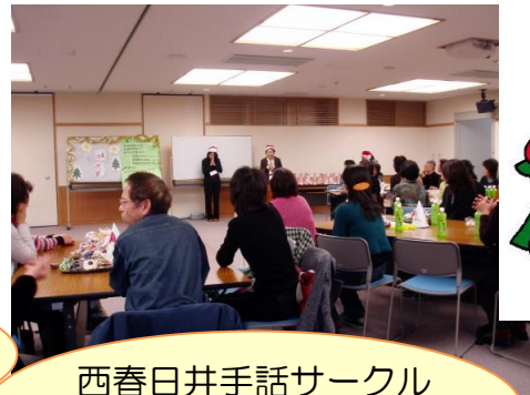
西春日井手話サークル 連絡会クリスマス会