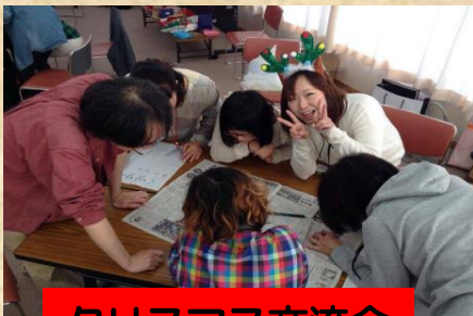
クリスマス交流会