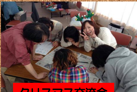
クリスマス交流会