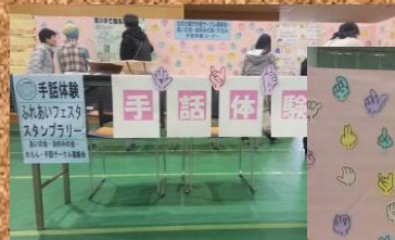
ふれあいフェスタ