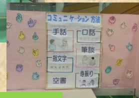
ふれあいフェスタ