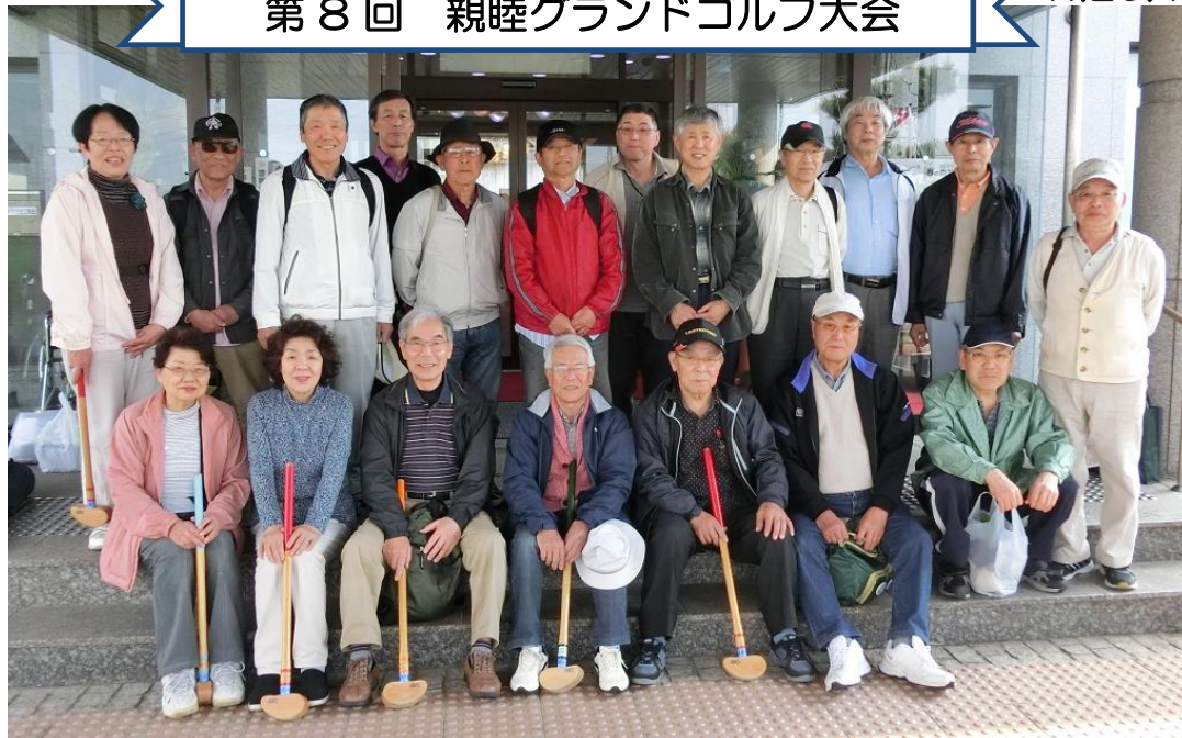
『北名古屋おもちゃ西病院』と親睦を兼ねて、年に1回グランドゴルフを行なっています。