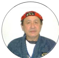
書記 面手 功