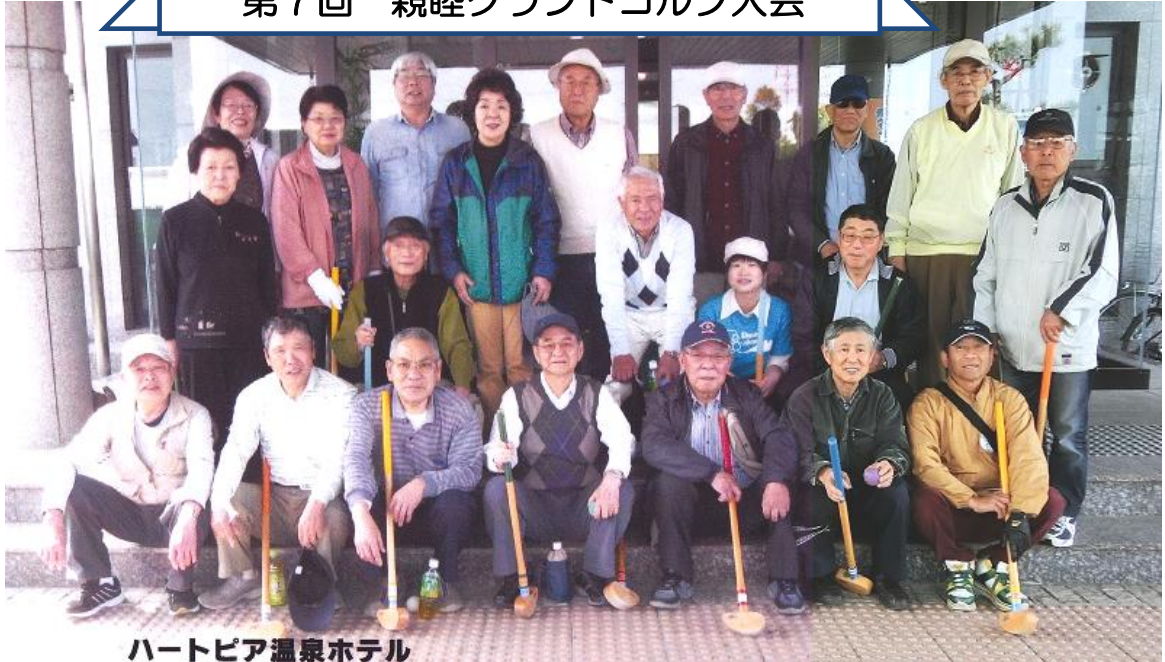
ハートピア温泉ホテル

『北名古屋おもちゃ西病院』と親睦を兼ねて、年に1回グランドゴルフを行なっています。