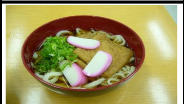
普通のきつねうどん