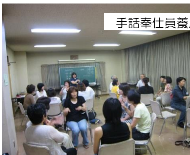
手話奉仕員養成講座