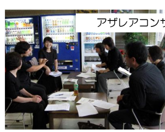
アザレアコンサートでの通訳協力