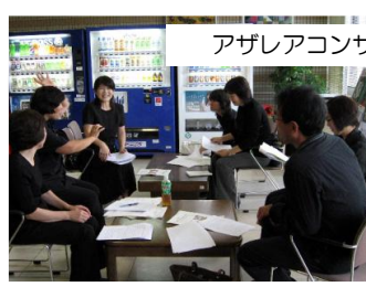
アザレアコンサートでの通訳協力