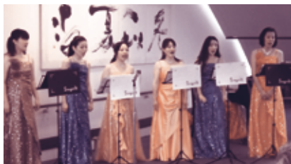
Singirlsによるコンサート (7月11日)