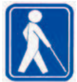
【盲人のための国際シンボルマーク】