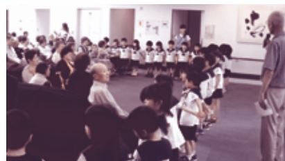
師勝幼稚園園児による「歌と踊り」 (7月12日)

もえの丘では、市民の皆さんにとって親しみのある施設となるよう、演奏や作品の展示をしていただける方を随時募集しています。