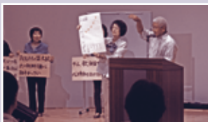
公開プレゼンテーションの様子

6月2日(土) 総合福祉センターもえの丘において、福祉のまちづくり推進援助事業に係る公開プレゼンテーションを行いました。市内で地域福祉を推進する10団体が参加し、それぞれの活動について熱い思いを込めて説明して頂きました。審査の結果、今回は10団体全てに助成金が交付されることになりました。有効適切に活用して頂き、市内の地域福祉をますます推進して頂けるものと期待しています。