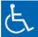
【障害者のための国際シンボルマーク】