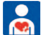
【ハート・プラスマーク】