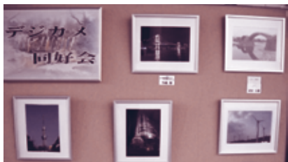
デジカメ同好会による「作品展」 (6月13日～6月20日)