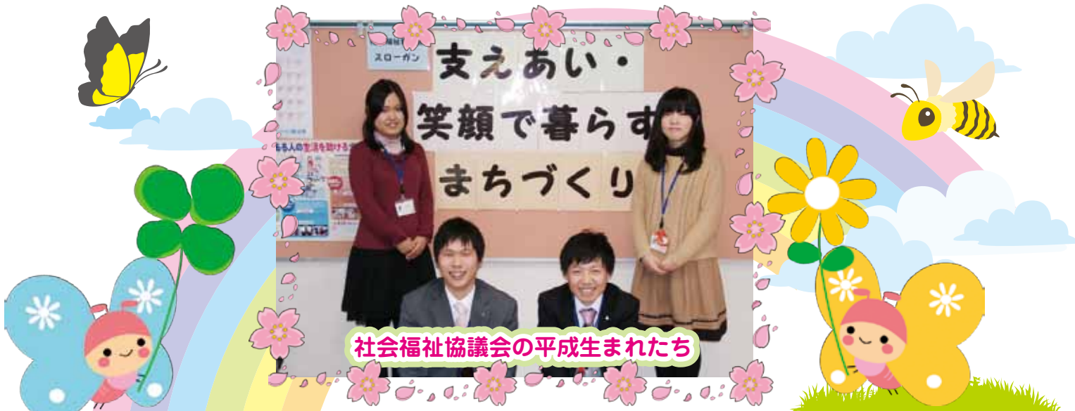
社会福祉協議会の平成生まれたち