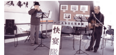
快宴隊によるコンサート (11月29日, 12月27日, 1月31日)