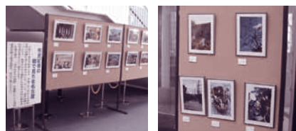
市民記者写真展 (1月24日~2月7日)