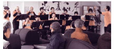
北のハーモニーによるハーモニカコンサート (12月8日)