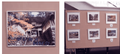
デジカメクラブ作品展 (11月30日~12月4日)