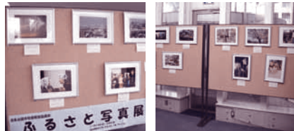
ふるさと写真展 (11月19日~11月29日)