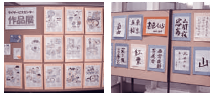
デイサービスセンターもえの丘利用者作品展 (11月5日~11月15日)