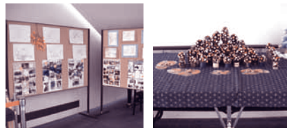
こぶしの会作品展 (12月5日~12月19日)