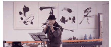
Rememberタカサンによるオカリナ&ギターコンサート (11月15日)(12月13日)(1月10日)