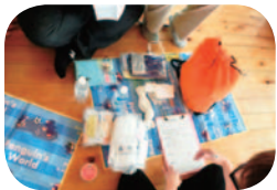
リュックの中身 簡易トイレ製作→

皆で協力しながら、楽しく進めていくことに意義があるのだと思いました。【広報 大野】