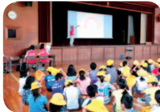
防災〇×クイズではあちらこちらから笑顔が・・・

夏休みの出校日の全体集会で「防災マップを作ろう」と防災クイズを北なごや防災ボランティアが担当しました。