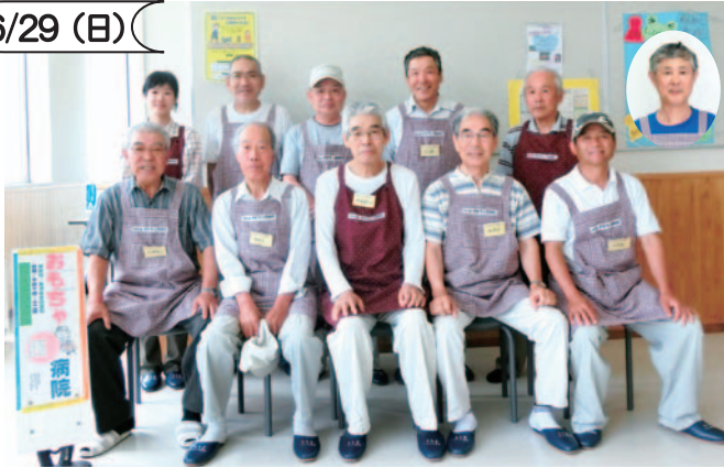
児童センター『きらり』2階にて