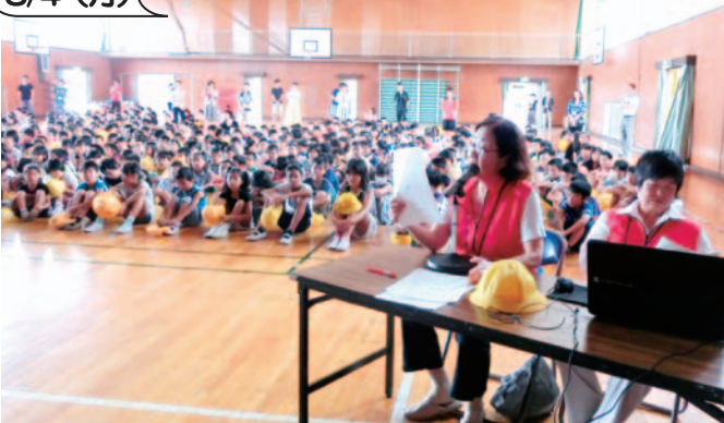
体育館でパワーポイントを使って 防災マップの作り方を分かりやすく解説