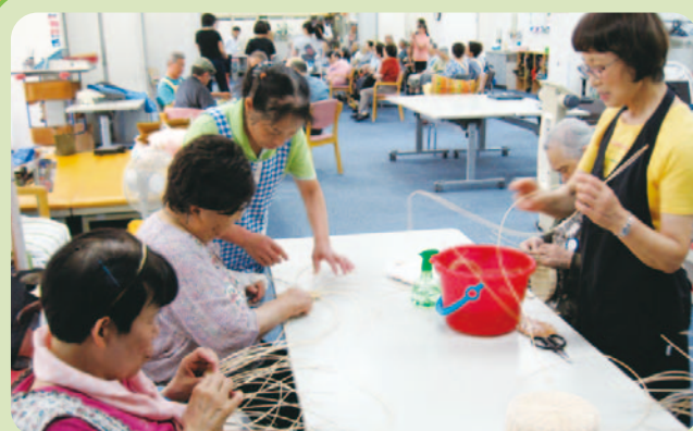
もえの丘デイサービスで月1回（火曜日）籐のカゴ作りを楽しんでいます。