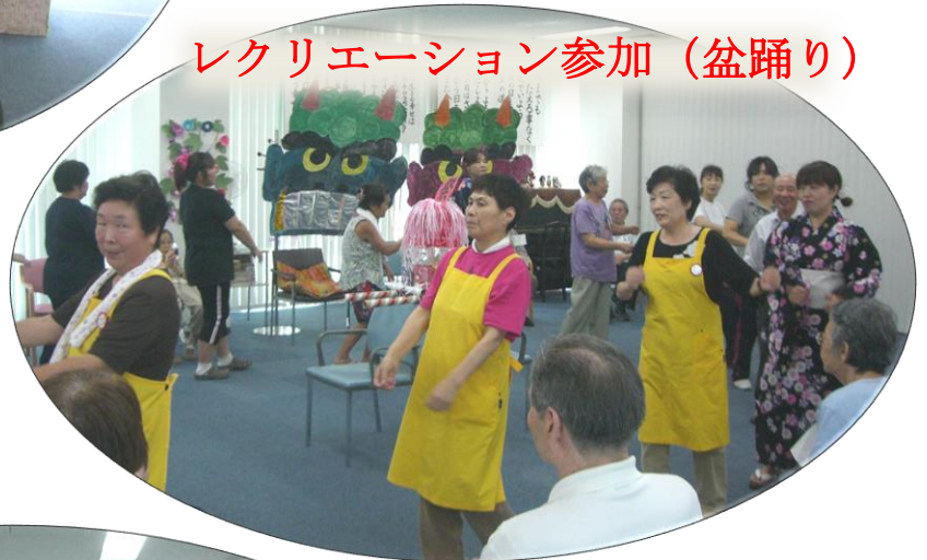
レクリエーション参加 (盆踊り)