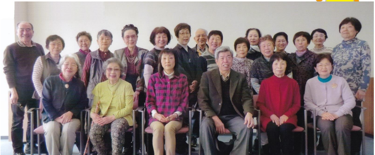
2019年度 てのひら 総会 平成31年4月10日(水)