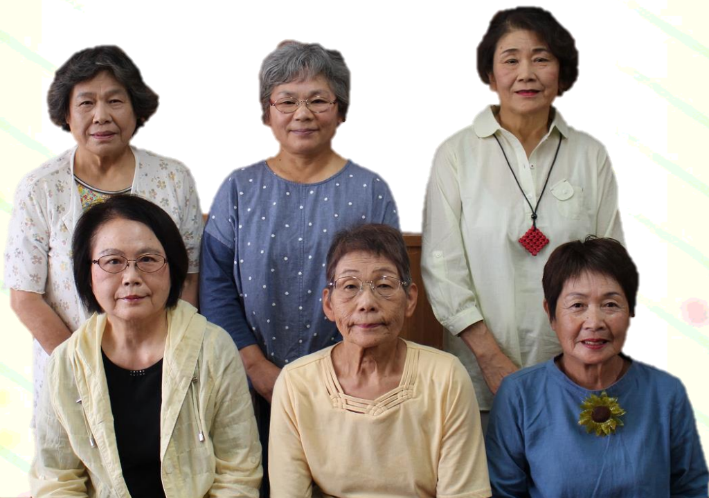
社協本所2階小会議室にて