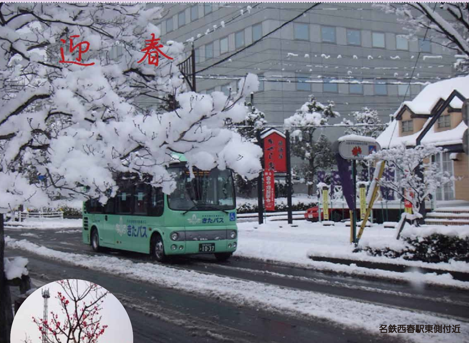
名鉄西春駅東側付近

発行:北名古屋市社会福祉協議会ボランティアセンター(Tel:0568-25-8500) 編集:北名古屋市ボランティア連絡協議会