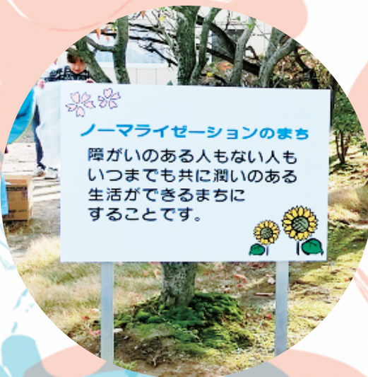
文化勤労会館東側文化の森に設置

これからも皆様からのご指導、ご鞭撻を頂きながら『ひまわりの会』はボランティア活動を続けてまいります。