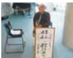
加藤九一コンサート