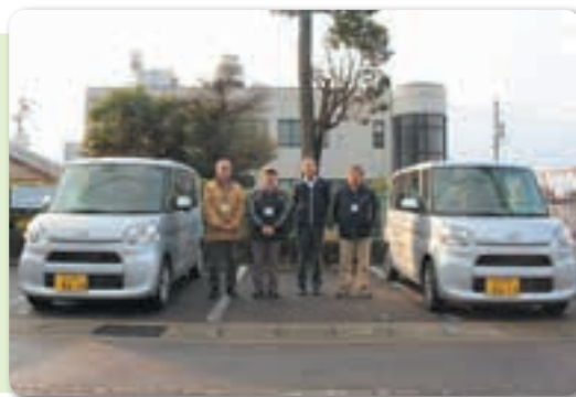
運転ボランティアの皆様