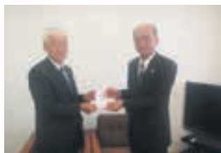
平成30年12月21日(金) 西春日井農業協同組合様より、 寄附をいただきました。