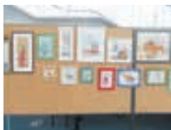
ちぎり絵サークル『ひなげし』作品展