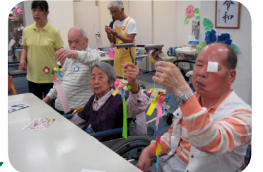
やっぱり健康第一ですね。