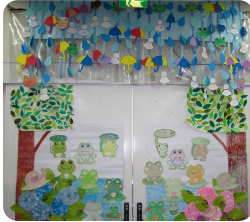
アジサイ、傘、カエル、テルテル坊主... 梅雨模様を壁紙にしました。