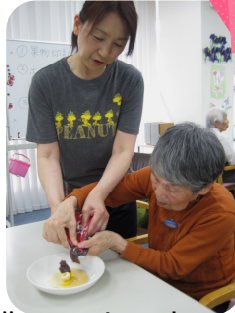
楽しみながら作ってま～す！