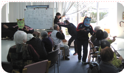
大変です！ デイルームに鬼が入って きました！