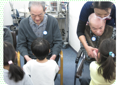
手遊びを一緒に楽しみました。