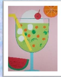
7月 クリームソーダ