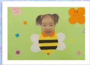
4月 かわいい蜂さん誕生