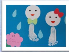
6月 てるてる坊主と足型