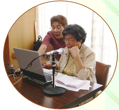
パソコンで広報録音中！

平成7年に結成してから毎月「広報」をテープに録音してきました。 現在は2ヶ月に一回となりましたがパソコンで行っています。 視覚障害の方に利用して頂き嬉しく思っています。 他の活動も楽しく参加して友達ができ、人への 思いやり、やさしさを学べ一石二鳥、それ以上 の多くのものを頂いている毎日です。 一緒に活動してみませんか。