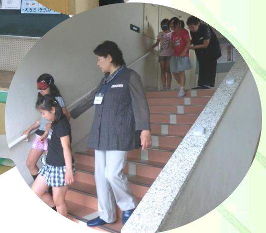
鴨田小学校4年生にガイドヘルプについての説明と実践指導