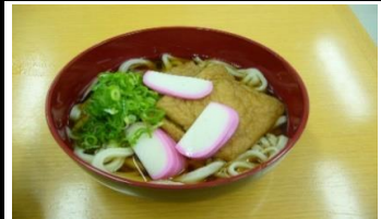
普通のきつねうどん