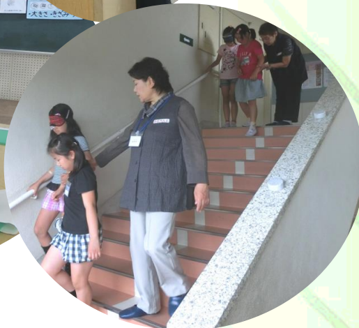
鴨田小学校4年生にガイドヘルプについての説明と実践指導