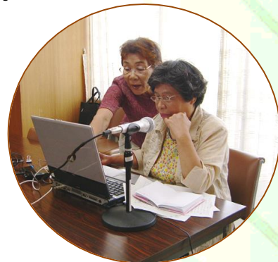
パソコンで広報録音中！

平成7年に結成してから毎月「広報」をテープに録音してきました。 現在は2ヶ月に一回となりましたがパソコンで行っています。 視覚障害の方に利用して頂き嬉しく思っています。 他の活動も楽しく参加して友達ができ、人への 思いやり、やさしさを学べ一石二鳥、それ以上 の多くのものを頂いている毎日です。 一緒に活動してみませんか。