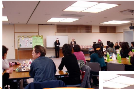
西春日井手話サークル 連絡会クリスマス会