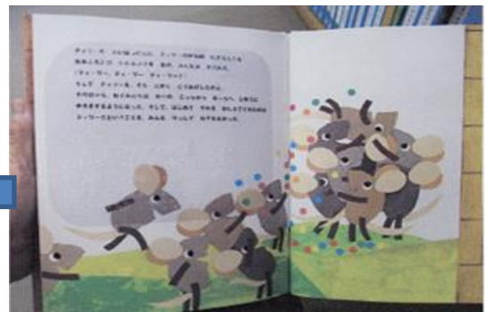
点字シールを張った絵本