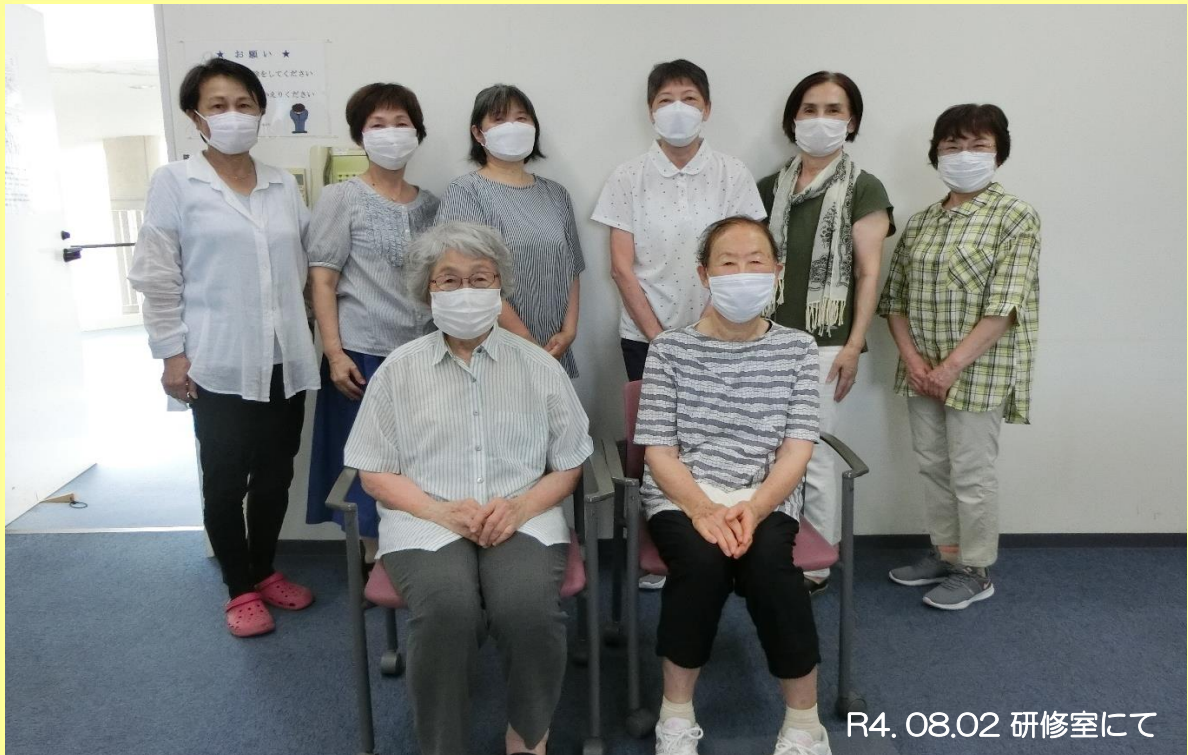
R4. 08.02 研修室にて