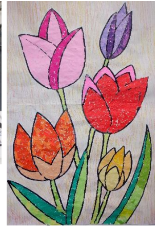
ぬり絵・パンジーの貼り絵・チューリップ。 春を迎える準備万端です。