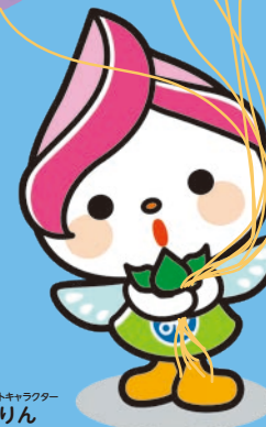
社団マスコットキャラクター にこりん